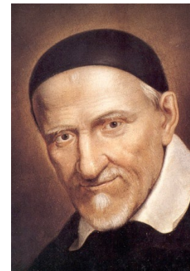
San Vicente de Paul